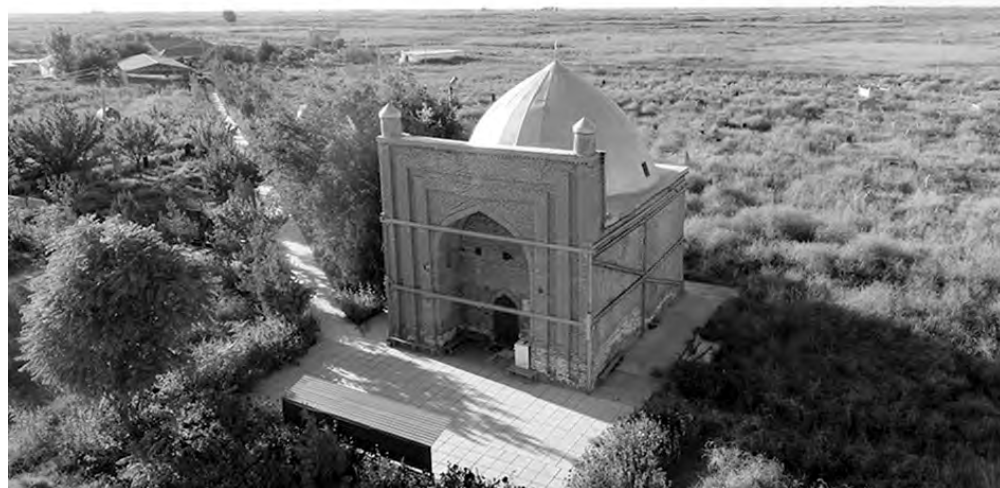
Суретте: Ұзын Ата кесенесі