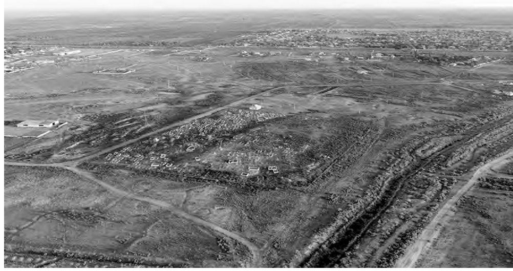
Суретте: Көксүтөбе елді мекені