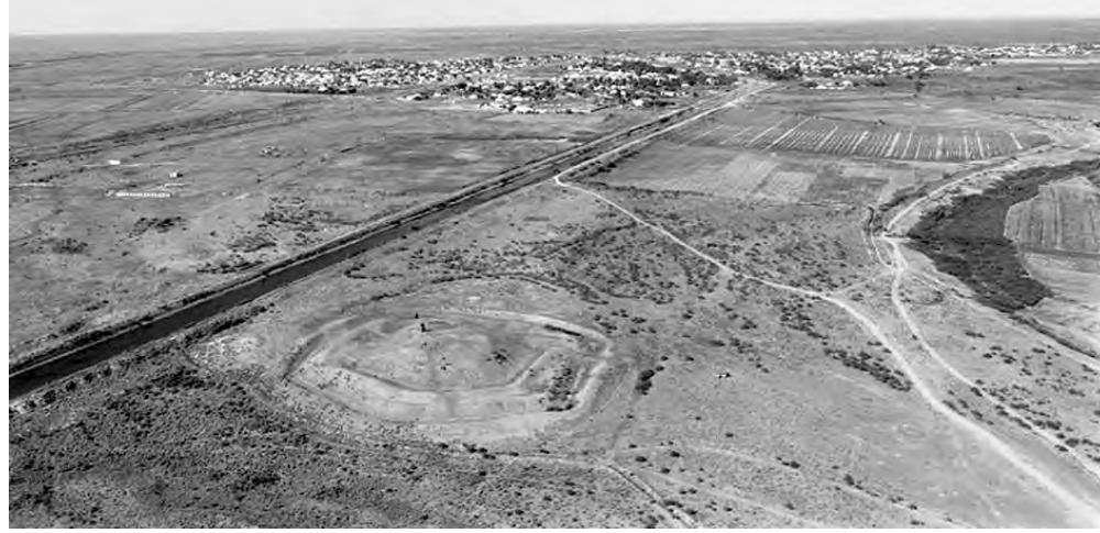
Суретте: Жаушықұмтөбе қалашығы

астында Ұзын ата мүрдесі жатыр, оған бір метрге жуықтайтын құлпытас қойылған. Ұзын ата Ақсақ Темірдің бас кеңесшілерінің бірі ретінде қасында еріп жүрген. Сыр бойы халықтарының ықыласына бөленіп, ел абызы, әлеумет қамқоршысы, әулие кісі атанған. Ескі аңыз-әңгімелерде Ұзын атаның шын аты Асан ата деседі. Әр сөзі дуалы Асан қария Ақсақ Темірдің бас кеңесшілерінің бірі болса керек. Оның Ақсақ Темірге айтыпты деген сөзі ел аузында. Асан ата (Ұзын ата) дүниеден өткенде, байсалды кеңесімен, терең ойымен тәнті еткен бас кеңесшісінің қазасы қабырғасын қайыстырған Ақсақ Темір ол кісінің басына бір күннің ішінде кесене салдырыпты. Ұзын ата елді мекені Ақсақ Темірдің Сырдария бойына жүргізген соңғы жорықтарының бірінде аяқ суытқан