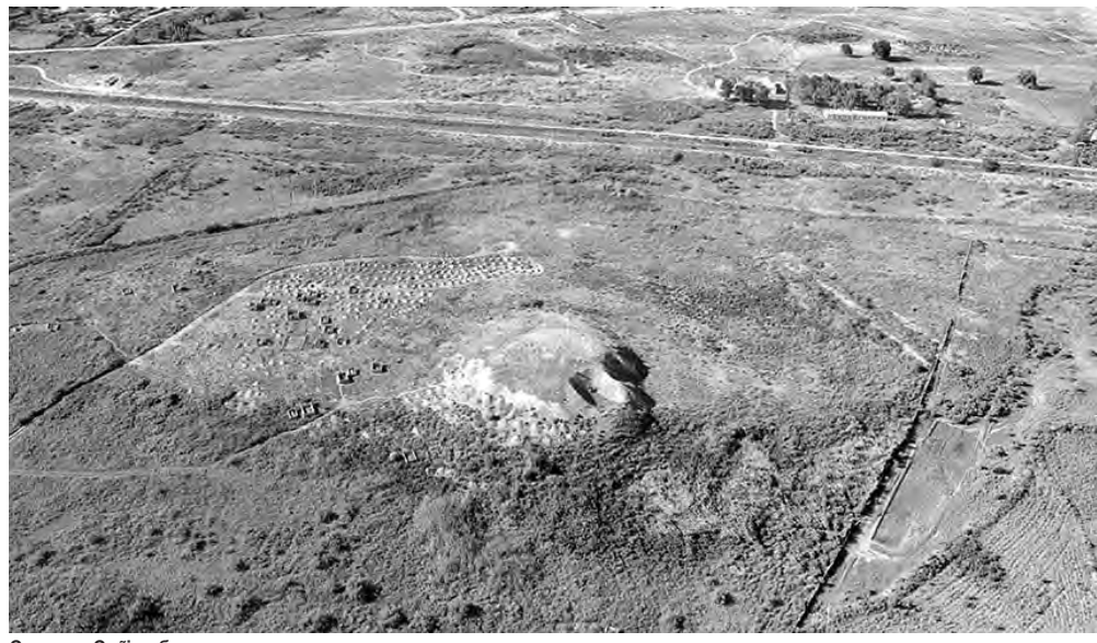
Суретте: Сейітөбе қаласы

• Солардың алғашқысы Сүткент-1 - Сырдариядан 2 км жерде, Қаракөл сайында солтүстік-батыстан оңтүстік-шығысқа қарай 800 м, солтүстік-шығыстан оңтүстік-батысқа қарай 900 м аумақты алып жатыр. Оны қоршаған ені 4 – 6 м, биіктігі 1 м-ге жуық дуалдың бойында орнатылған 30 мұнараның орындары сақталған, дуалды сыртынан қоршай қазылған ордың тереңдігі 1 – 1,5 м, ені 8 – 10 м. Қалашықтың шығыс шетінде су жинайтын үлкен тоғанның орны бар. Оның өлшемі 100 ч 350 м, тереңдігі 1 м. Су Сырдариядан арнайы