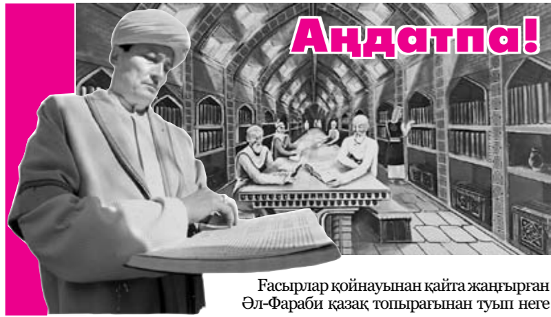
Ғасырлар қойнауынан қайта жаңғырған Әл-Фараби қазақ топырағынан туып неге

Шам еліне аттанды? Өркениеті дамыған Отырар қанша ғұлманың отаны? Орта ғасыр философиясының бүгінде құны қандай? Зерттеулер мен жазба деректер Еуропаның даму тарихының бастауын неге әл-Фарабимен байланыстырды? Екінші ұстаздың қабіріне бірге кеткен шығармалары қандай? Осы және өзге де сұрақтардың жауабын, сондай-ақ қазақ ғалымдарының Фараби мұрасына көзқарасы туралы деректі фильмді